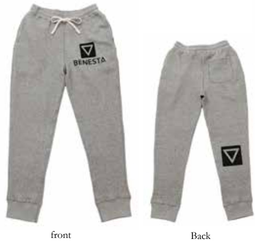
◆ Vintage Hether Gray