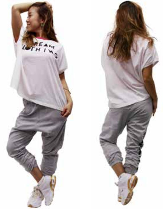
model 154cm wear size M