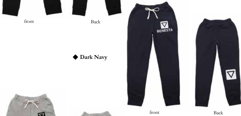
◆ Dark Navy