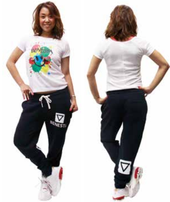
model 154cm wear size