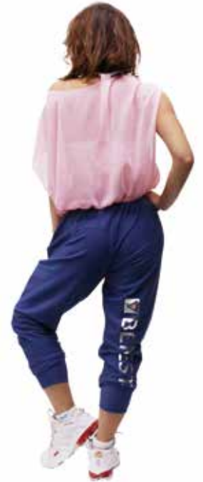
model 154cm wear size M